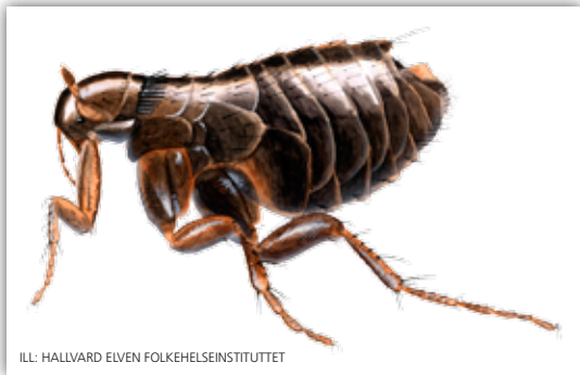
ILL: HALVARD EIVEN, FOLKEHELSENSTITUTTET

Loppa kan hoppe 60 ganger sin egen høyde. Det tilsvarer at en fuglehund kunne hoppet fra bakkenivå til toppen av Oslo Rådhus.